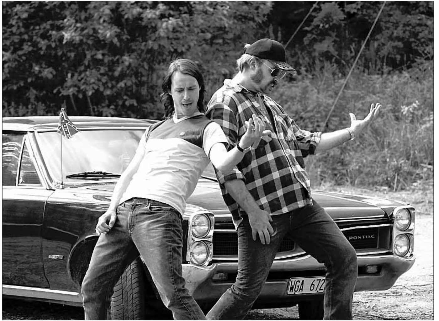
Fotbollsfilmen "Offside" visas på Bio Park i helgen.

"Gustaf II" visas för andra veckan i rad på söndag. Denna gång följer Gustaf sin ägare Jon på nya äventyr till London. Där blir han av misstag förväxlad med en kunglig katt och som den lasagne-älskande Gustaf inte är sen att utnyttja.